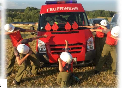
Gleich vier Pokale (in Form von Flammen) holten unsere Jungflorianis beim Abschnittsbewerb in Leopoldschlag!