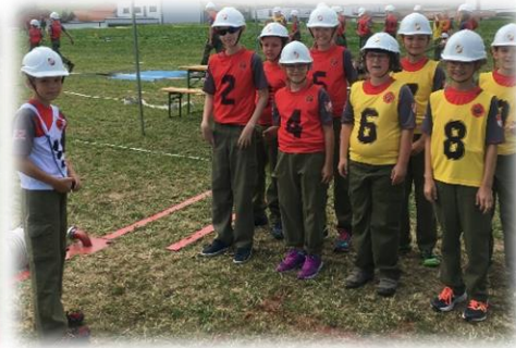
Summerau 3 startete in Leopoldschlag. Für sechs neue Mitglieder war dies der erste Bewerb!