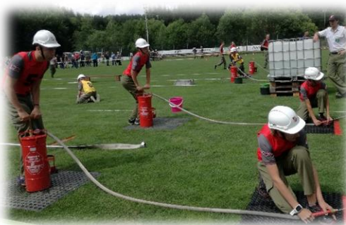
Summerau 1 beim Bezirksbewerb in Weitersfelden

Bei den vier Bewerbungen im Bezirk Freistadt waren wir drei Mal mit zwei Gruppen und einmal sogar mit drei Gruppen!! am Start. Summerau 1 konnte mit konstant guten Leistungen den 8. Platz (von 60 Gruppen) in der Bezirkswertung Bronze und den tollen 4. Platz (von 54 Gruppen) in der Bezirkswertung Silber erreichen.