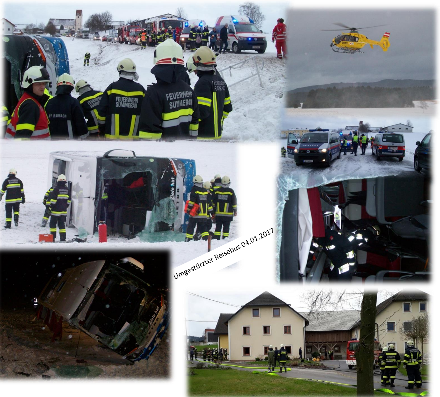
Umgestürzter Reisebus 04.01.2017

21 Einsätze gab es im Kalenderjahr 2017 zu bewältigen! Im Jänner gab es zwei schwierige Einsätze: Nördlich von Rainbach stürzte ein Reisebus um. Mehrere Verletzte wurden von einem Großaufgebot an Rettungskräften versorgt. Die Koordination zwischen Feuerwehr, Rettung und Polizei hat hervorragend funktioniert! Mitte Jänner wurden wir von der ÖBB zu einem Bahnübergang zwischen Summerau und Hörschlag gerufen, Einsatzgrund „Person vor Zug“. Anfang Februar rückten wir zu Pumparbeiten nach Eibenstein aus und Mitte März wurde die Gemeindestraße Nähe Schober/Pirau von einem umgestürzten Baum wieder freigemacht. Wir verzeichnen immer mehr „Wespennest-Entfernung“ Einsätze, heuer waren es insgesamt vier. Im April führten wir einen Lotsendienst durch und wurden zu einem Brand nach Böhmendorf alarmiert. Aufgrund erhöhter Brandgefahr stellten wir eine Brandwache beim Petersfeuer der Stockschützen. Mitte Juli war ein Kleinbrand in Zulissen der Alarmierungsgrund. Anfang August galt es eine längere Dieselölspur zwischen Fa. Waldhauser und Bahnhof Summerau zu binden. Mitte August wurden vier Bäume im Summerauer Ortsgebiet nach Sturmschaden entfernt und bei Schweißarbeiten der Gas-Connect-Austria in Apfoltern ein Brandschutz gestellt. Ende August machten wir einen Lotsendienst und zwei technische Hilfestellungen. Ende September und Ende Oktober folgten weitere zwei Lotsendienste. Im November wurden wir zu einem Kellerbrand nach Hörschlag gerufen.