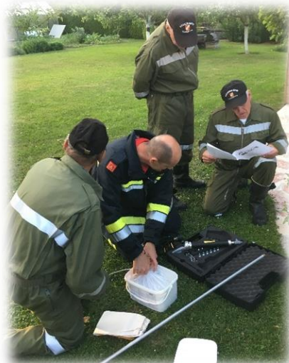
Im Zuge einer „Routiniers“-Übung wurde unser neues Wespennest-Entfernungsgerät ausprobiert.

Der zweite Teil war eine praktische Übung der theoretisch gelernten Inhalte am 25. März. 24 Personen waren gekommen, um einen wirklich interessanten Ausbildungsnachmittag beizuwohnen.