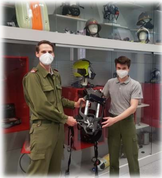
Übergabe neue Atenschutz Dräger PSS 5000

Feuerlöscher müssen alle zwei Jahre überprüft werden und nach max. 25 Jahren ausgeschieden und somit neu angeschafft werden.