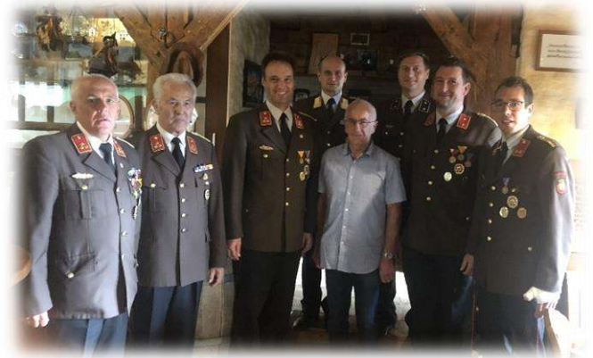
Leopold Auer zum 70er